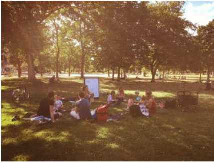
Club Alpha - im Alaunpark